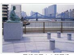
展望庭園内の芭蕉像