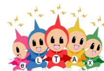
eLTAX イメージキャラクター エルレンジャー

●国税の電子申告・電子納税等については、 e-Tax ホームページ ( http://www.e-tax.nta.go.jp/ ) をご覧ください。