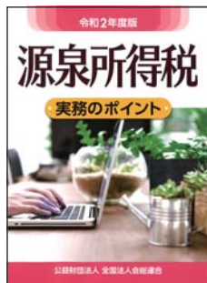
②令和2年度版 源泉所得税の実務のポイント