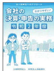
④令和2年度 会社の決算・申告の実務