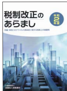
③令和2年度 税制改正のあらまし