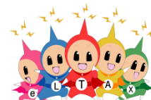
eLTAX イメージキャラクター エルレンジャー

●国税の電子申告・電子納税等については、 e-Tax ホームページ ( http://www.e-tax.nta.go.jp/ ) をご覧ください。