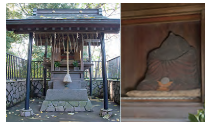
栄誉権現者<お狸様>

そしてその奥にあるのは、栄誉権現社（別名お狸様）です。大奥にありましたが、悪いことが起こるので大名屋敷に移され、そこでも悪いことが起こるので転々とした。大正時代に上野東照宮に移されると悪いことが起こらなくなったとのこと。今では「他抜き」で強運・必勝の神として親しまれています。