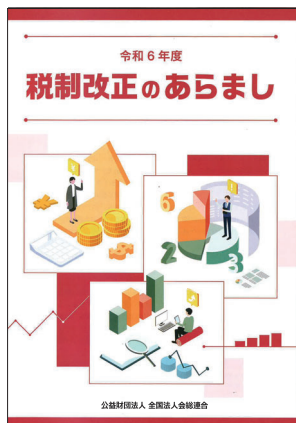
令和6年度 税制改正のあらまし