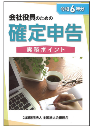
令和6年分 会社役員のための 確定申告実務ポイント