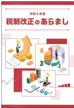
令和6年度 税制改正のあらまし