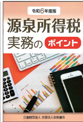
令和6年度版 源泉所得税実務の ポイント