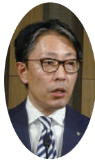
東京税理士会上野支部 興津支部長