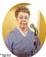
ご挨拶 森重女性担当副会長