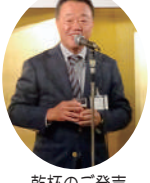
乾杯のご発声 金海副会長