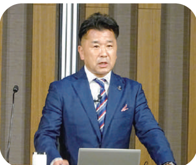
元日本代表 世界選抜 吉田義人氏