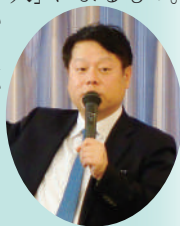
株式会社 幸楽苑ホールディングス 代表取締役社長

ラーメンチェーン店で有名な「幸楽苑」の代表としてのご苦勞話を講演いただきました。業績がV字回復したのは、結局は「人」によるもの。優秀な人材を伸ばすことがいかに大事であるかを力説されていました。皆さんとても熱心に聴講されていました。