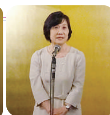
中立女性部会長(再任)の挨拶