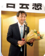
志賀前青年部会長の挨拶