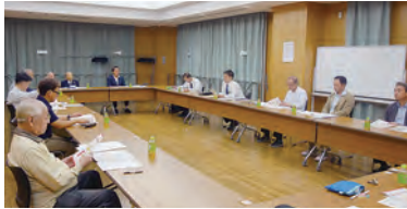
令和6年10月16日(水)東上野地区センター