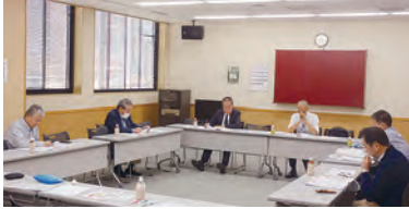
令和6年10月11日(金)台東地区センター