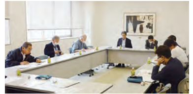
令和6年10月17日(木)朝日信用金庫西町ビル