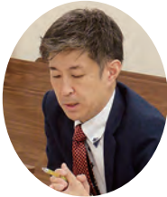
▲金子上席国税調査官