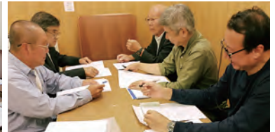
令和6年10月23日(水)山ぎし