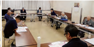
令和6年10月18日(金)金杉区民館下谷分館