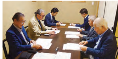
令和6年10月17日(木)宮川