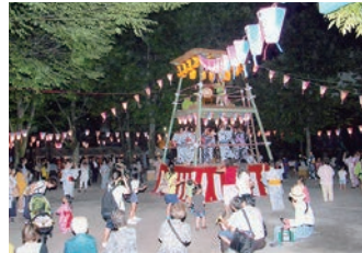
平成28年7月26日(火)~29日(金)御徒町公園 初日は雨天中止でしたが残り3日 間で約1,000人が参加しました。