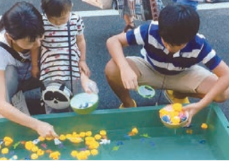
平成28年8月6日(土)~7日(日)台東1-15-6 参加券を利用した税金クイズ、抽選会等で楽しく過ごしました。