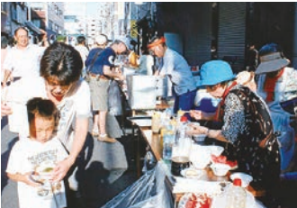
平成28年8月6日(土)東上野1-7-10道路 納涼のタベが実施され和気 藹々の交流が出来ました。