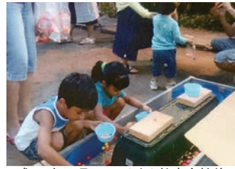
平成28年7月23日(土)竹南会館前