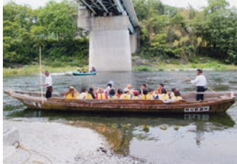
平成28年6月12日(日)秩父郡長瀬町 うどん作りやライン下り等、親子 で楽しい一日を過ごしました。