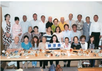
平成28年7月20日(水)吉池食堂9F カラオケ大会、ハズレくじ無しの 抽選会は大変盛り上がりました。