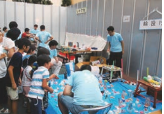
平成28年8月10日(水)黒門小学校 当日は雨も降らず、約1,400 人の方が来場し大盛況でした。