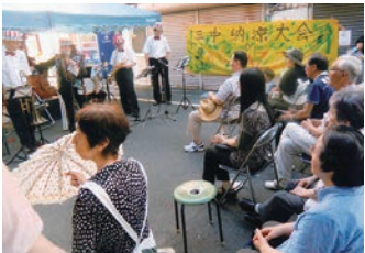
平成28年7月31日(日)中町会本通り 晴天に恵まれ約130名の参加 があり大変盛り上がりました。