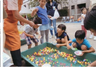
平成28年8月27日(土)西町公園 雨予報でしたが終了間際まで 降らず大変盛り上がりました。