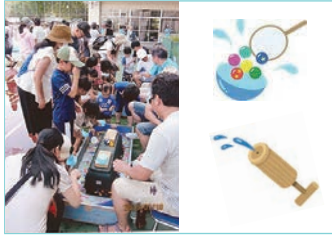
平成28年7月18日(月)平成小学校校庭