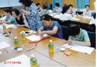
平成28年7月12日(火)東上野区民館 香袋を作成後、昼食等を取り ながら交流を図りました。