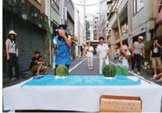
平成28年7月30日(土)町会館前面道路 ラジオ体操後、すいか割りを して甘いスイカを楽しみました。