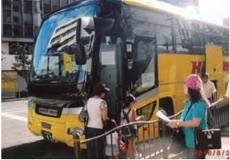
平成28年8月21日(日)横浜八景島シーパラダイス 水族館をはじめ4つの施設がある アクアリゾートで楽しめました。