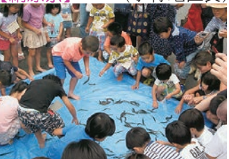
平成28年7月23日(土)天理教正門前 子供イベントのドジョウ掴み、 スイカ割りは大賑わいでした。