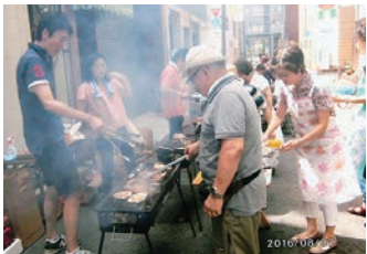
平成28年8月7日(日)東上野2-12遊歩道 子供から御年配まで幅広く交 流を深めることが出来ました。