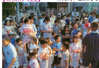
平成28年8月6日(土)東上野児童遊園 約300人の老若男女が参加 し、楽しい一日を過ごしました。