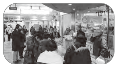
☆午前 10:00 亀戸駅をスタート

今年度の新春散歩は、亀戸七福神めぐりを開催しました。当日は雲ひとつない快晴で、新春の穏やかな日差しの中、江戸の伝統と粋を今に残す亀戸界隈をゆったりと散策することができました。暖冬傾向のせいか、早咲きの花もちらほら見られ、下町の風情を引きだたせていました。最後に立ち寄った亀戸天神は大勢の人で賑わっており、全員で参拝して解散となりました。今回の亀戸七福神は回りやすいコースになっており、全行程をゆっくり巡っても2時間ほどで回れるので、初心者の方でも歩きやすいコースだったのではないかと思います。興味をもたれた方は是非チャレンジしてみてください。