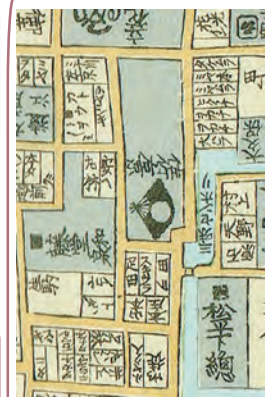
「問⑩資料」『台東区歴史・文化テキスト』付録地図より 台東三・四丁目付近