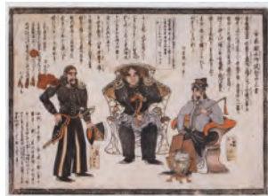
◆ペリー来航時(1853(嘉永6)年)の瓦版(横浜開港資料館蔵)