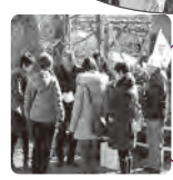
☆12:15 亀戸天神にて解散。参加者の皆様、お疲れ様でした。